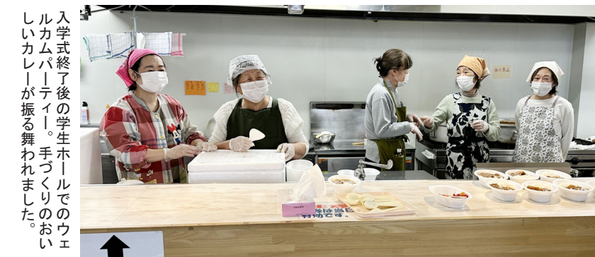
入学式終了後の学生ホールでのウェルカムパーティー。手づくりのおいしいカレーが振る舞われました。