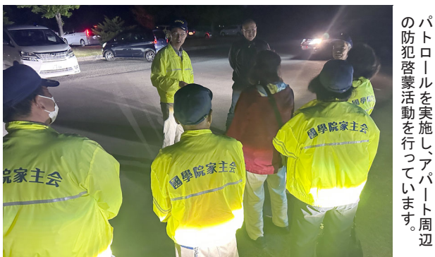
北海道警察の認可を受け、青色防犯パトロールを実施し、アパート周辺の防犯啓蒙活動を行っています。