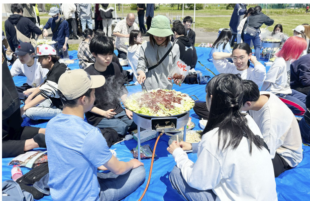
6月2日、学生、家主、教職員、およそ80名が参加し、クリーン作戦を行いました。終了後は、ジンギスカンパーティーで交流を深めました。