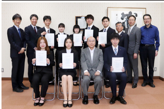
特待生に奨学金30万円支給